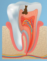
Stade 2 Atteinte de la dentine Sensibilité sucre/froid